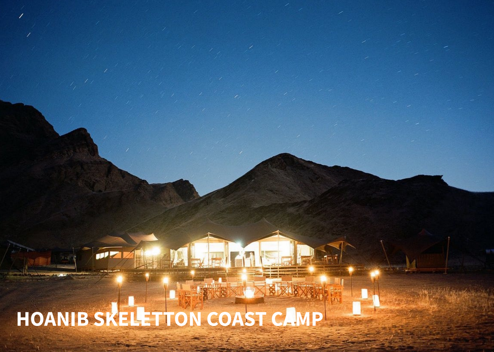
HOANIB SKELETON COAST CAMP